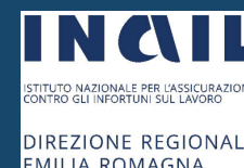
Direzione Regionale INAIL Emilia Romagna