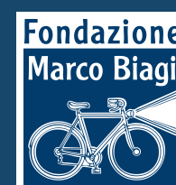
Fondazione Marco Biagi UNIMORE