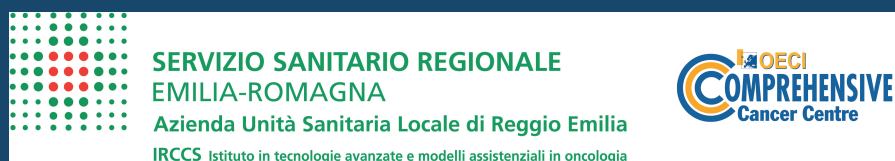
Azienda Unità Sanitaria Locale di Reggio Emilia