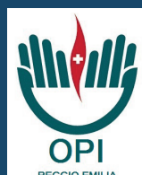
Ordine delle Professioni Infermieristiche di Reggio Emilia