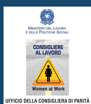
Consigliera di Parità di Reggio Emilia