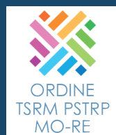
Ordine Professionale dei T.S.R.M. P.S.T.R.P. di Modena e Reggio Emilia