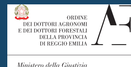
Ordine dei Dottori Agronomi e dei Dottori Forestali della Provincia di Reggio Emilia