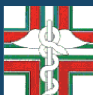
Ordine dei Farmacisti di Reggio Emilia