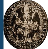
Ordine degli Avvocati di Reggio Emilia